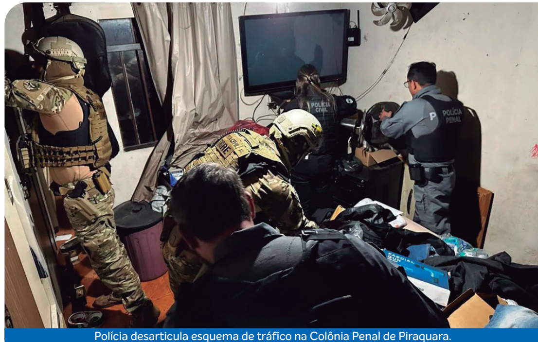
Polícia desarticula esquema de tráfico na Colônia Penal de Piraquara.