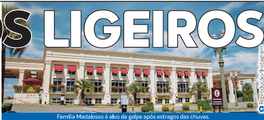
Família Madalosso é alvo de golpe após estragos das chuvas.

podem auxiliar nas investigações. Outras recomendações podem ser consultadas na cartilha de prevenção à golpes da PCPR.