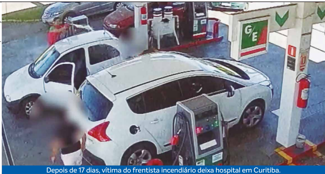
Depois de 17 dias, vítima do frentista incendiário deixa hospital em Curitiba.

Bruna Quaglia Colmann Especial para Tribuna