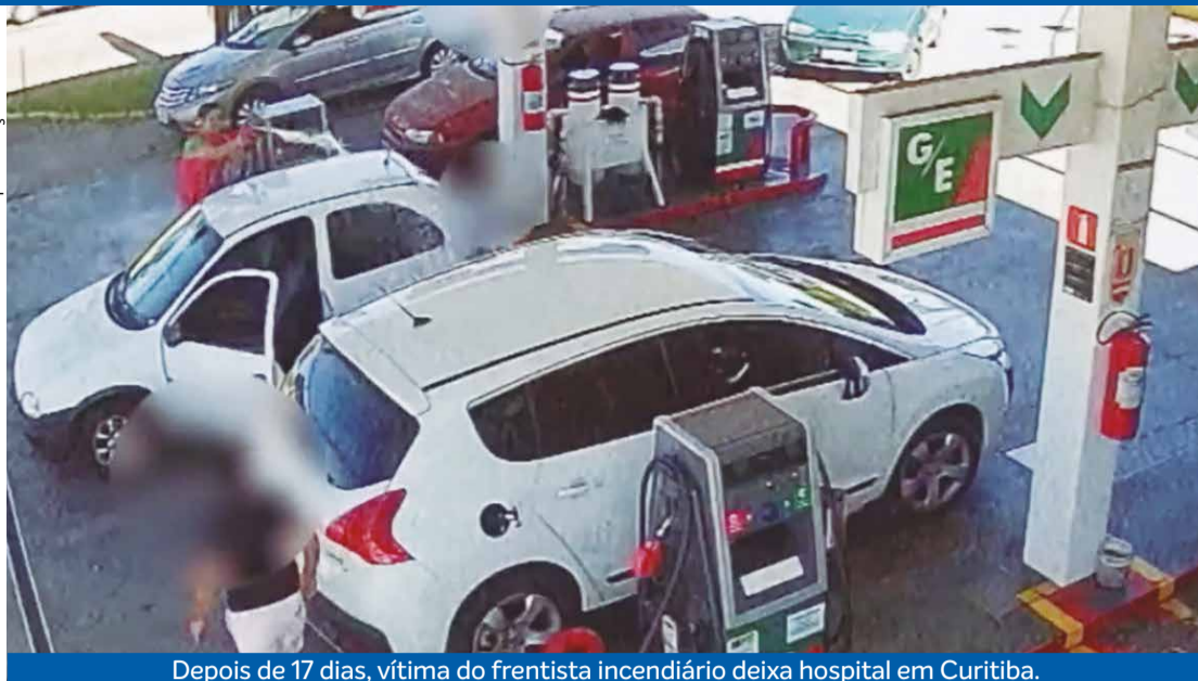
Depois de 17 dias, vítima do frentista incendiário deixa hospital em Curitiba.

Bruna Quaglia Colmann Especial para Tribuna