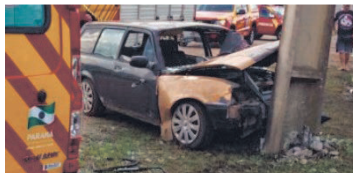
No momento do acidente, oito pessoas estavam no veículo.

Após os primeiros socorros, três pessoas, incluindo um bebê de um ano e cinco meses,