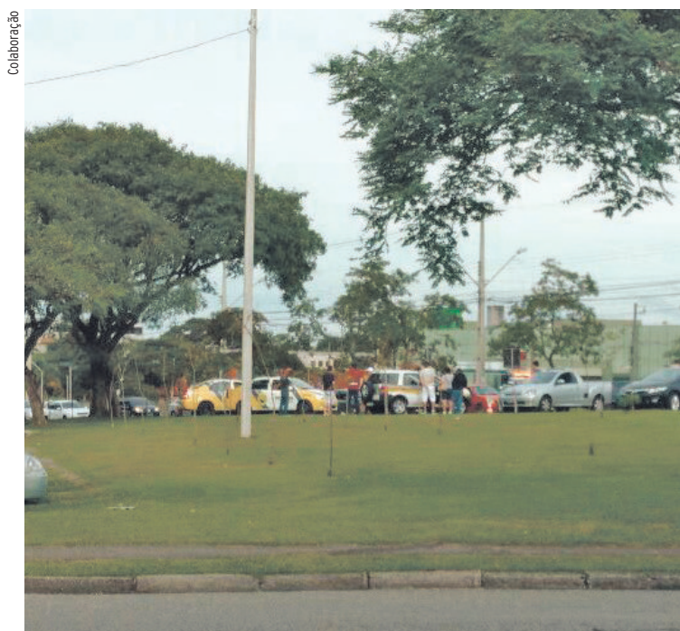
Suposto sequestro do filho do governador era só uma briga de trânsito.

Quando passaram ao lado do Jardim Botânico e viram viaturas da PM, ocupantes de um dos carros resolveu pedir ajuda. Para isto, teria de alguma forma citado o nome do governador e, passadas de uma pessoa a outra, as informações tomaram proporções maiores, de que se tratava do sequestro do filho do governador. O mal entendido foi rapidamente esclarecido e o BPTran continuou atendendo o acidente de motocicleta.