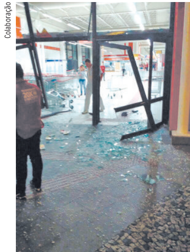
Fachada ficou destruída e pelo menos 60 celulares foram levados.

O veículo, conforme a polícia, foi apreendido e tinha indícios de que poderia ter sido o mesmo usado na ação. O estabelecimento, que já chegou a funcionar 24h e atualmente atua das 8h às 23h, estava fechado no momento do furto. Nenhum dos autores foi encontrado. A Delegacia de Furtos e Roubos (DFR) fica responsável pelas investigações da ação.