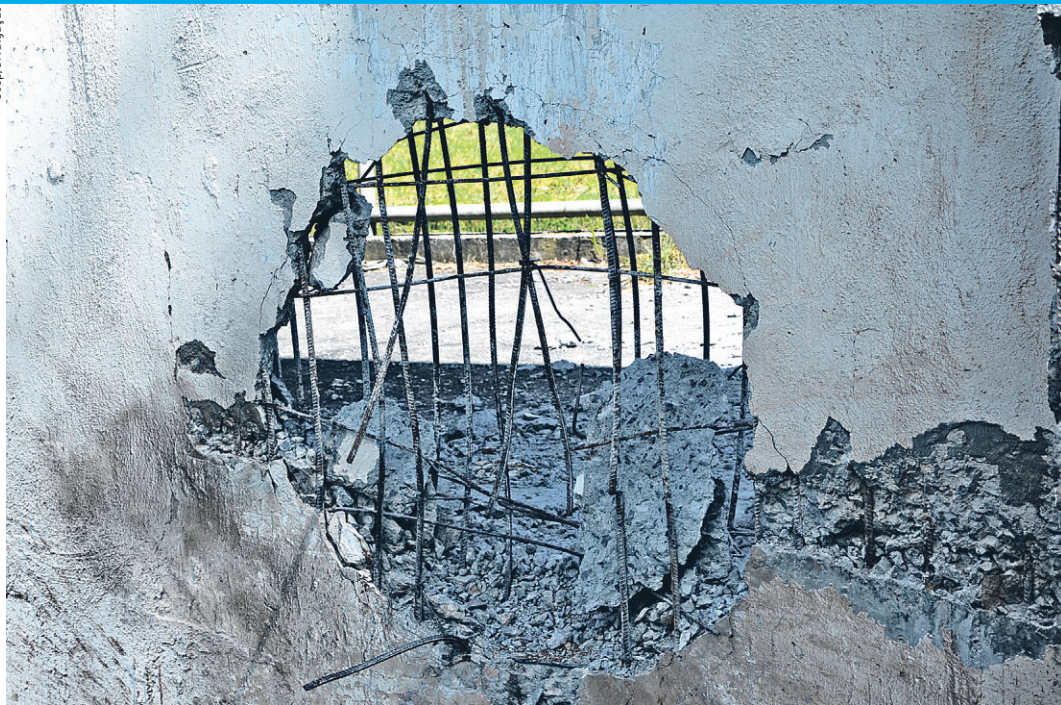
Portando armas pesadas e explosivos, marginais detonaram o muro e abriram passagem pros detentos.

Por isso, as forças policiais solicitam que a população colabore com as buscas ligando para o 190, para o Disque-Denúncia 181 ou pelo site www.181.pr.gov.br , serviços que garantem o anonimato.