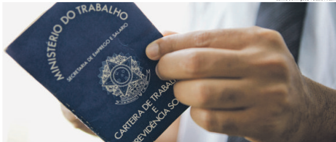
Reforma pode diminuir custos e burocracia, mas pode levar a uma precarização das condições de trabalho.

Para analistas, o tripé da reforma proposta pela nova equipe está centrado na terceirização, permanência do Programa de Proteção ao Emprego (PPE) e flexibilização da CLT, ao permitir que acordos feitos entre o sindicato e a empresa prevaleçam sobre o que determina a legislação. Além disso, está no radar a criação de duas novas modalidades de contrato de trabalho: parcial