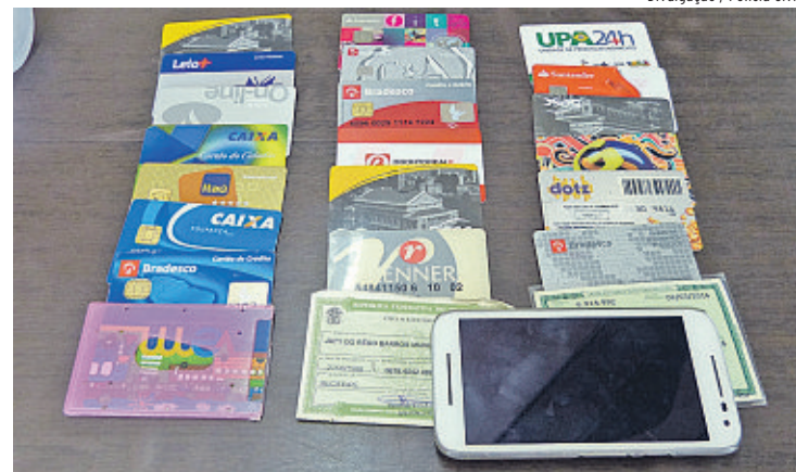
Preso dava nomes e dados divergentes pra confundir a polícia.

No Paraná, a suspeita começou a realizar empréstimos em nome da sogra e pegar dinheiro da família dizendo que posteriormente pagaria. Desconfiada, a vítima relatou a situação à polícia, que passou a investigar e constatou que a