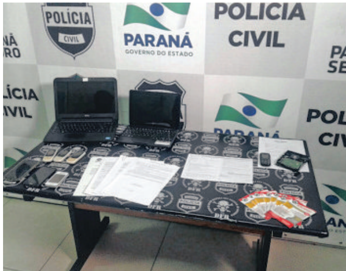
Diversos documentos e celulares foram apreendidos na operação.

Na casa da advogada e do marido, os policiais encontraram uma Fiat Doblô adaptada para o uso como ambulância. O veículo não foi apreendido, mas os policiais investigam o uso da ambulância clandestina. (LS)