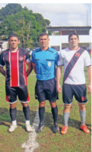
Combate não resistiu à boa atuação do Vasco da Gama.

Uberlândia 2x2 Capão Raso e Grêmio Ipiranga 1x1 Imperial.