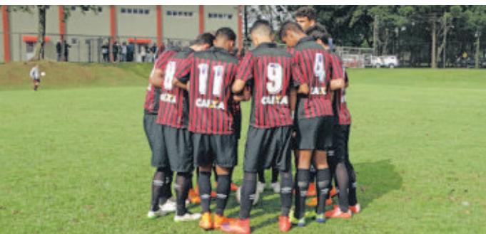
Atlético joga amanhã, no Caju, pra garantir vaga na final Sub-17.