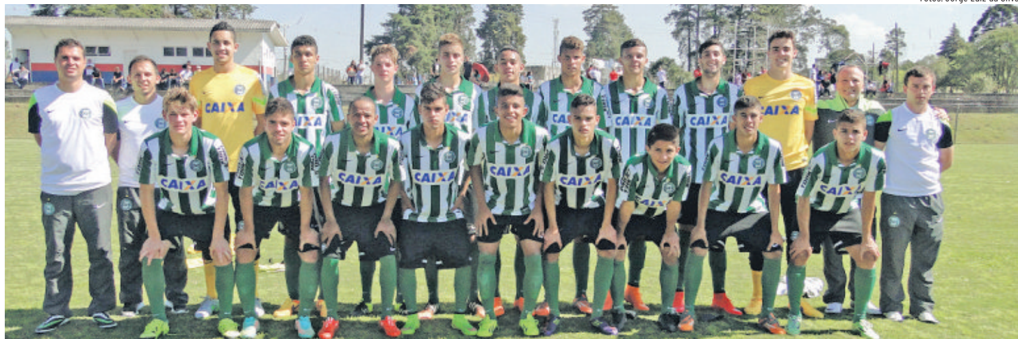
Coritiba está na final do Estadual Sub-17. Provavelmente vai encarar o Atlético.

Precisando reverter a situação, o Paraná Clube começou indo pra cima do Coxa, porém, foi