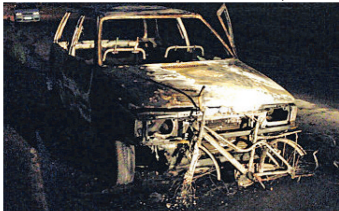
Colaboração: Alexandre Xavier

Bombeiros descobrem corpo de homem no banco de trás de carro incendiado