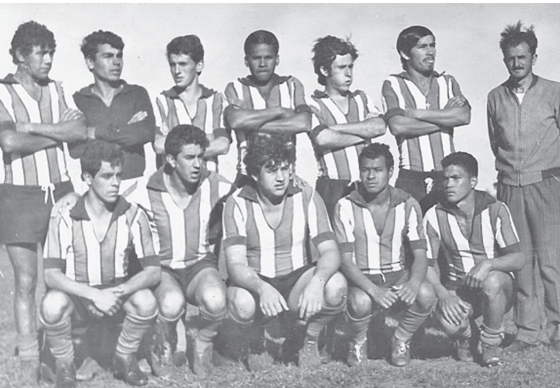
Time campeão pela primeira vez, em 1970.

Clube completa 62 anos repletos de histórias e títulos importantes, principalmente na Divisão de Acesso