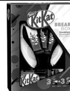
Chocolate KIT KAT Headphone 174,6g Quant. Disp. 5000 un

Srs. Clientes, Informamos que em nosso Encarte de Páscoa , com validade de 16/03/2018 a 31/03/2018 , a oferta do produto Ovo de Páscoa Nestlé KIT KAT Headphone 174,6g foi veiculada com a descrição incorreta. A oferta correta é Chocolate KIT KAT Headphone 174,6g , conforme ao lado.