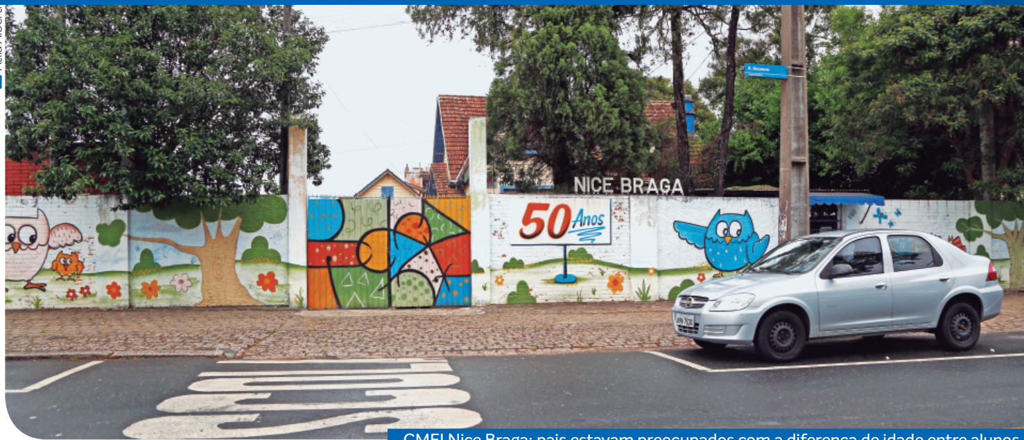
CMEI Nice Braga: pais estavam preocupados com a diferença de idade entre alunos.

Ele ocorre a partir das 8h em frente ao CMEI Nice Braga. A concentração será na praça em frente ao CMEI, na Rua Bocaiuva.