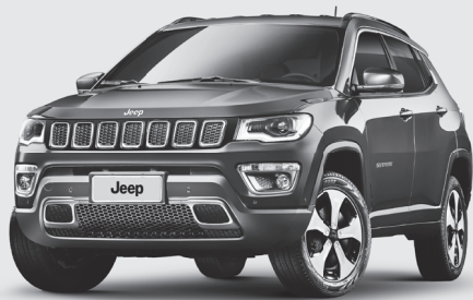
Relação de chassis (não sequenciais)